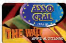
La Assocral Card