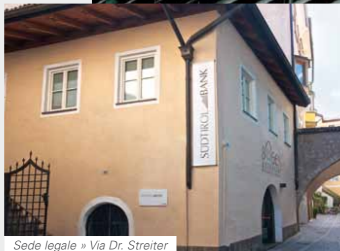
Sede legale » Via Dr. Streiter