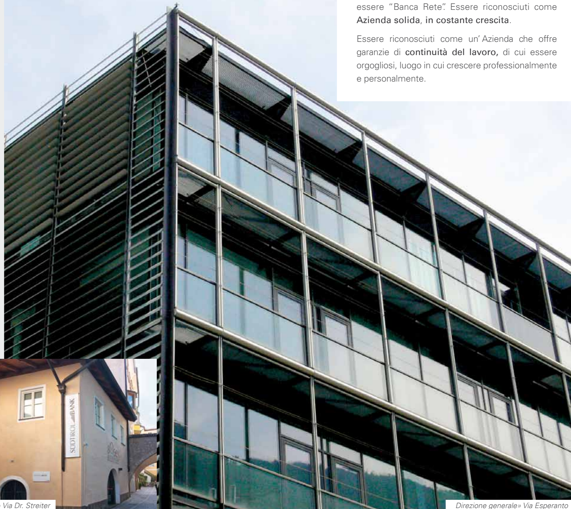
Direzione generale » Via Esperanto

Essere riconosciuti come un'Azienda che offre garanzie di continuità del lavoro , di cui essere orgogliosi, luogo in cui crescere professionalmente e personalmente.